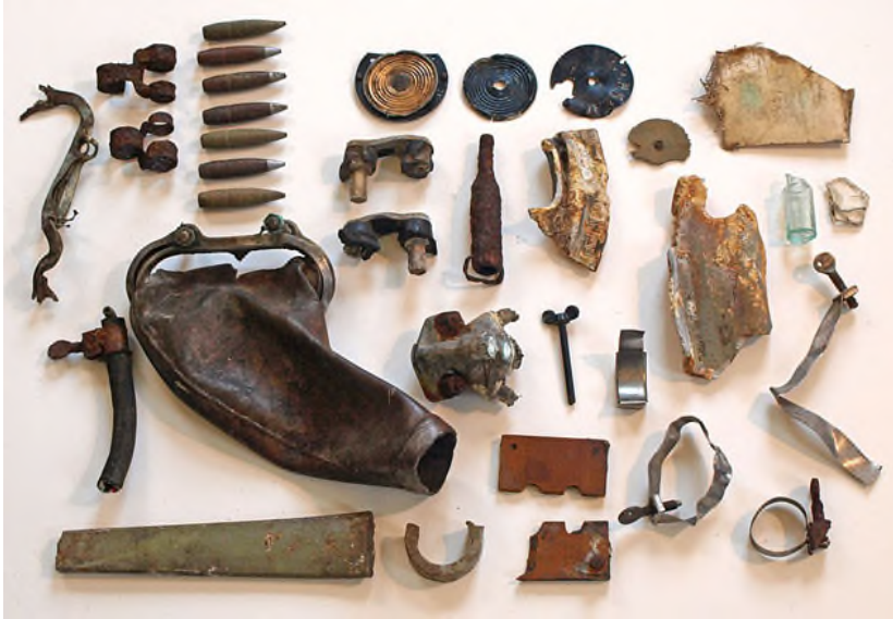
Rester af det nedskudte fly.