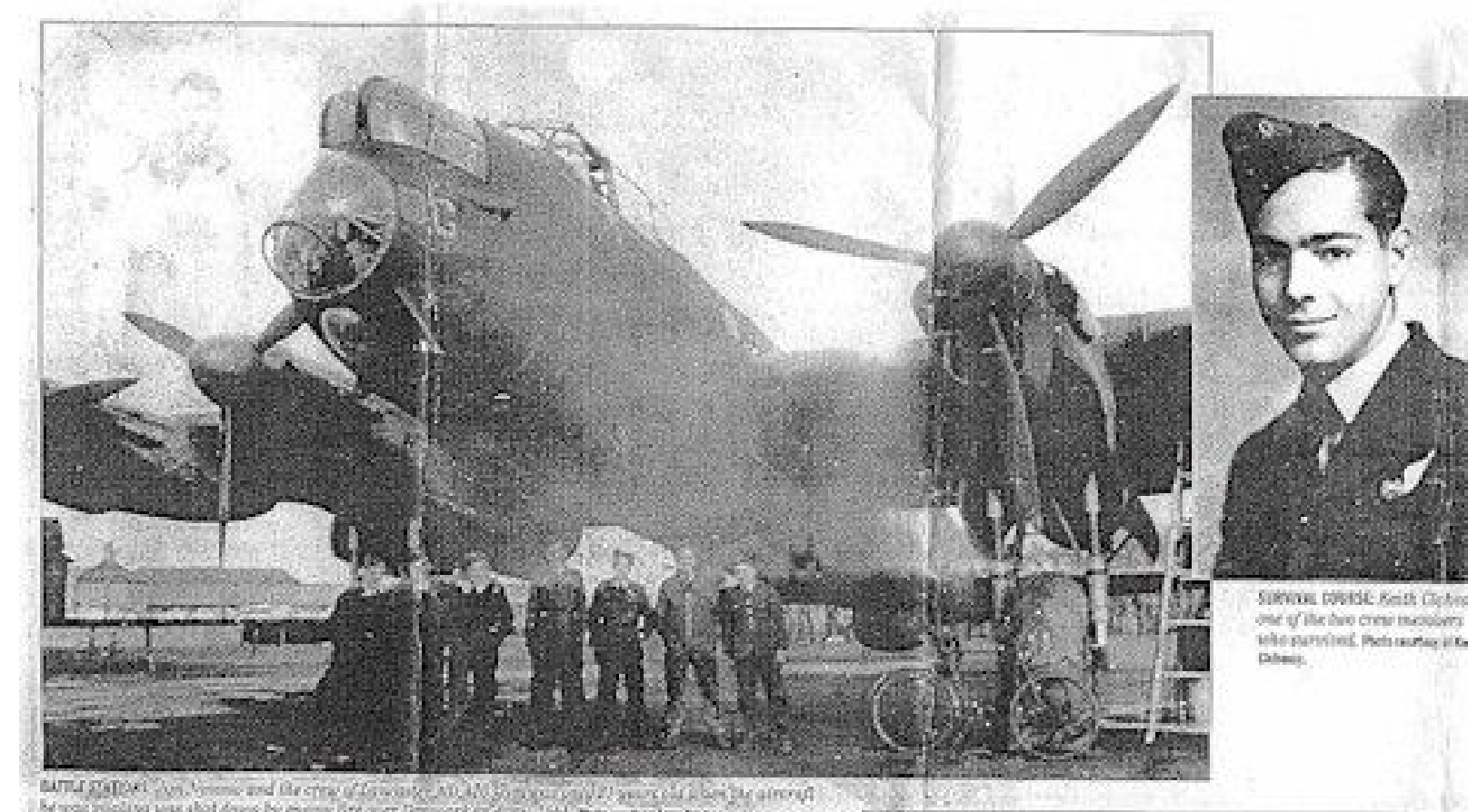
På billedet ses Lancaster ND 420 med besætning. På det lille billede ses Keith Clohessy.