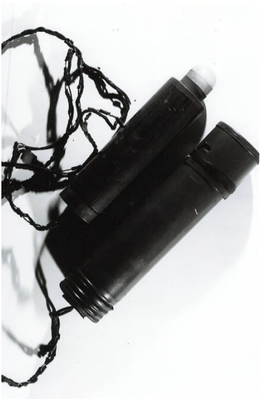
Signallampe fra det nedstyrede RAF fly