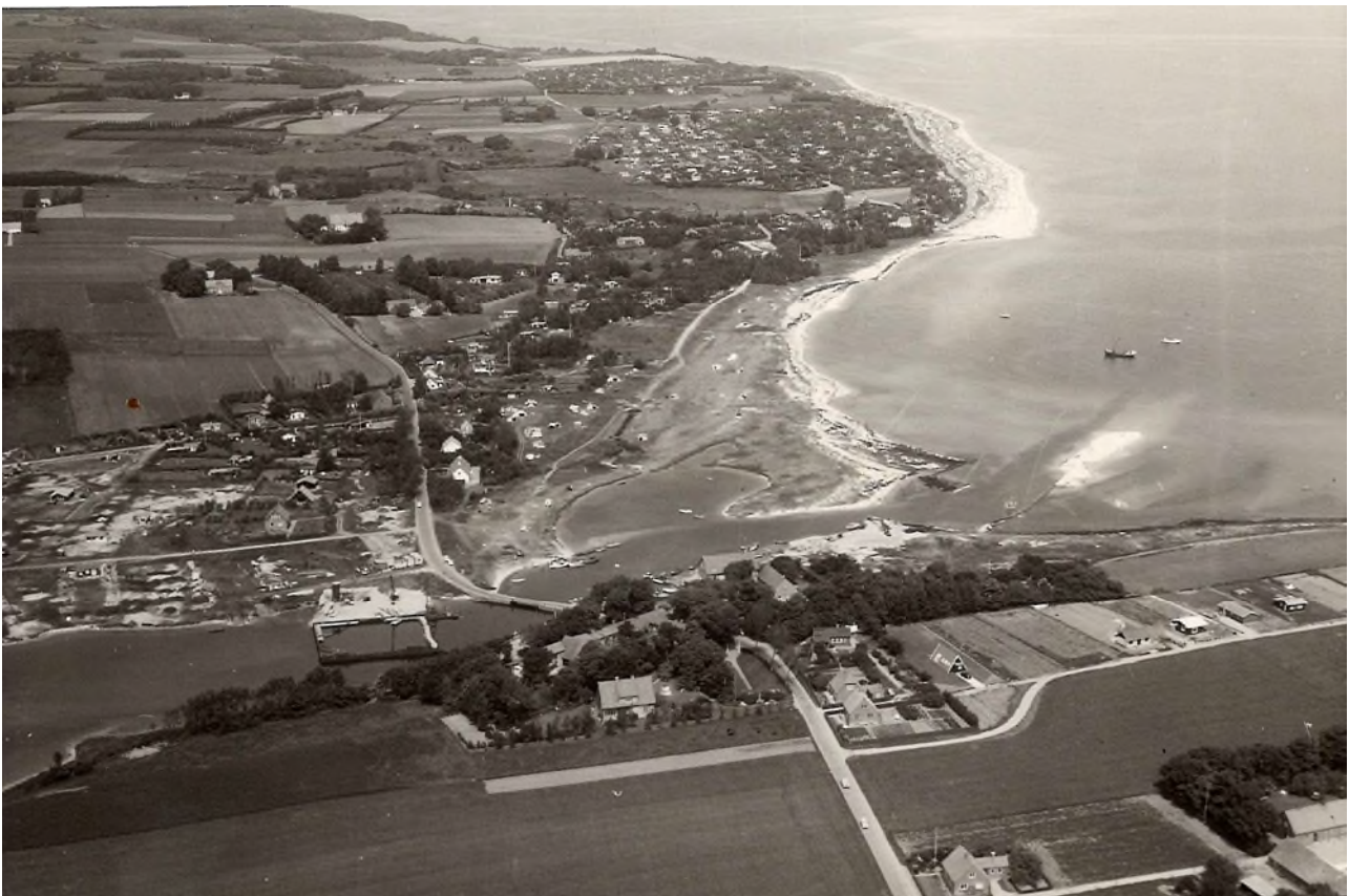
Norsminde Havn og bugten. Norsminde Flak ligger 7 km fra havnen.

Omkring 1200 flyvere blev dræbt i Danmark, 400 taget til fange, mens ca. 100 slap videre til Sverige.