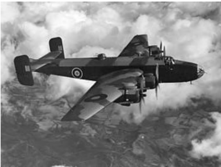
Halifax fire-motorers bomber fly. Jomfruflyvning i 1939, anvendt af RAF fra 1940. Foto.Wikipedia

Royal Air force (RAF) 138. eskadrille fløj under krigen med våben og agenter til lande, der var besat, deriblandt Frankrig og Danmark. Der udførtes også et betydeligt antal flyvninger til Polens hjemmehær mellem 1941 og 1943. Flyruten gik hen over Danmark. Afstanden til Polen indebar omkring 14 times flyvetid på en rundflyvning, hvilket var på kanten af flyenes aktionsradius. Flyet var ofte af typen Halifax- et fire motorers tungt bombefly anvendt til natlige togter over besatte områder. I løbet af de to år var der kun 40-50 nætter, hvor vejrforholdene muliggjorde operationer. I september 1943 planlagde man "Operation Neon" med nedkastning af 29 faldskærmsfolk og politiske kurerer samt mængder af materiel. Seks polske piloter tog sig af nedkastningen af faldskærmsfolk, mens briterne tog sig af afleveringen af materiel.