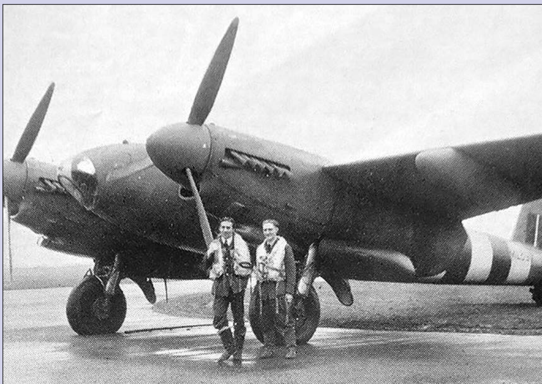
Figur 2. En Mosquito med sin to mands besætning, fra SHELLHUSET 21.-3.-1945.

vetid fra målet, så flyene havde bombelemmene åbne. Andre lystårne i området ses på Google Map Shellhuset.