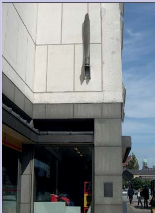
Figur 4. Propelblad og mindetavle på Shellhuset, foto Anders Straarup.

MOS NT123 blev over Københavns Havn ramt i den ene motor af antiluftskyts. Piloten meddelte over radioen, at han ville prøve at