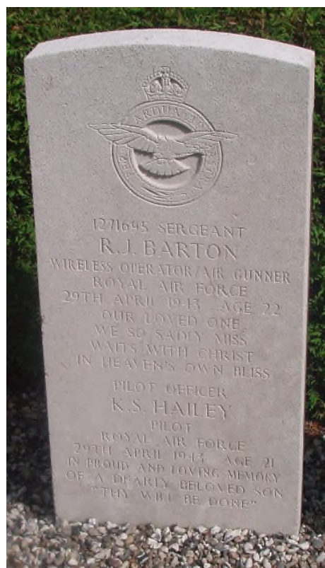
Gravstenene på Aadum Kirkegård