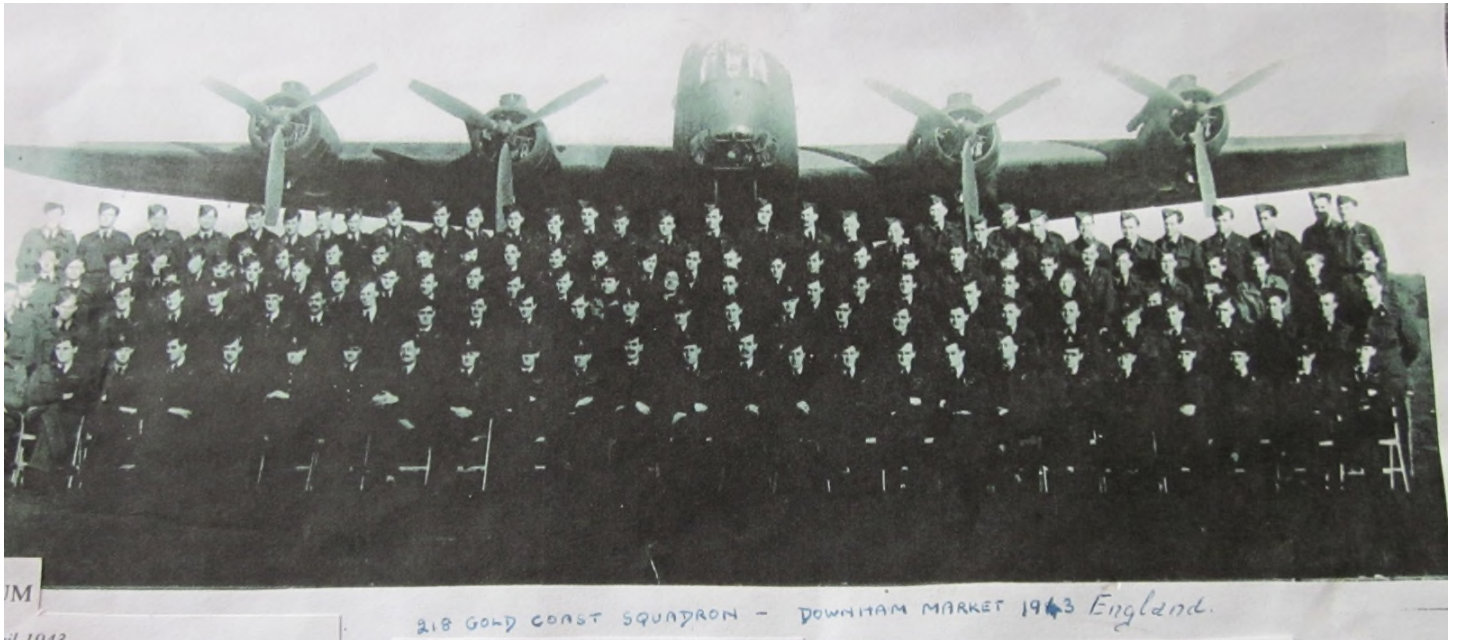
218 Gold Coast Squadron – Downham Market 1943 England – hvorfra besætningen kom.

Besætningen i Stirling EF 356 (HA-O) bestod af: