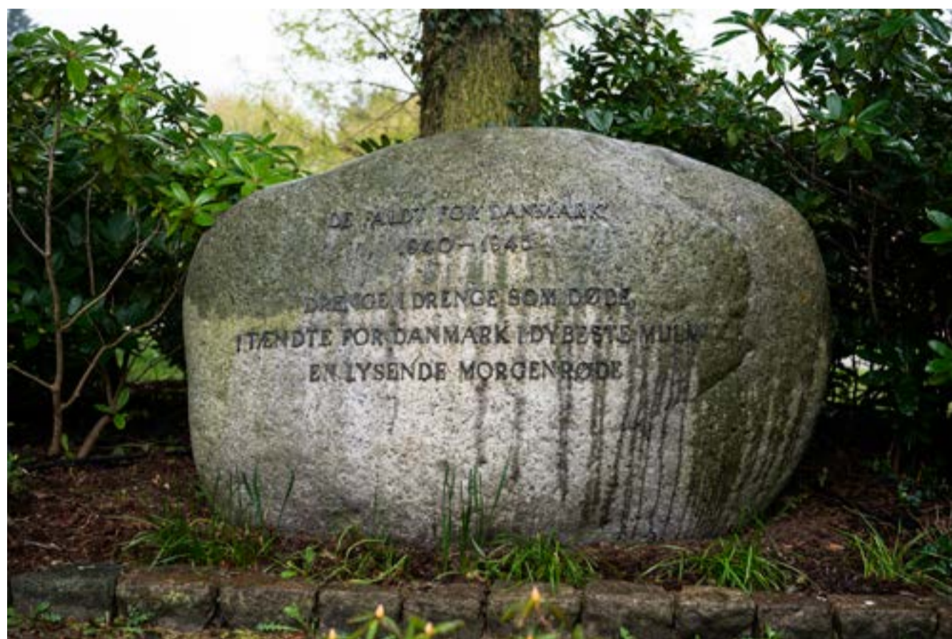
Mindestenen med Kaj Munks tekst.