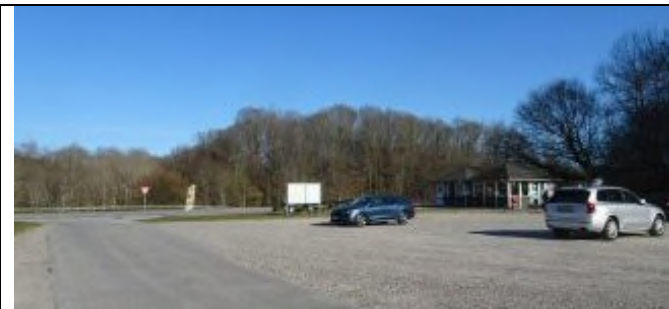
Hadsund Landevej 430, 9260 Gistrup, Grill & Ishytten

AirmenDK fortæller om 463 allierede fly og 3.089 flyvere skudt ned over Danmark eller danske farvande under Anden Verdenskrig. Vi har stadig 1.030 allierede flyvere begravet i Danmark.