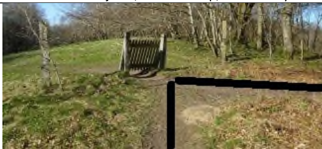
3. Til højre lige før lågen.