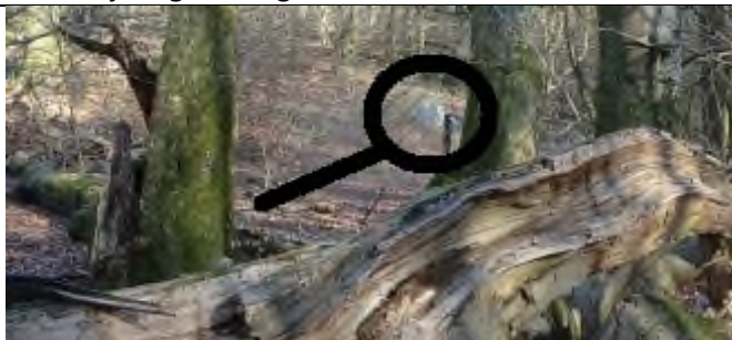
5. Se FLYVERSTENEN og informationstavle.