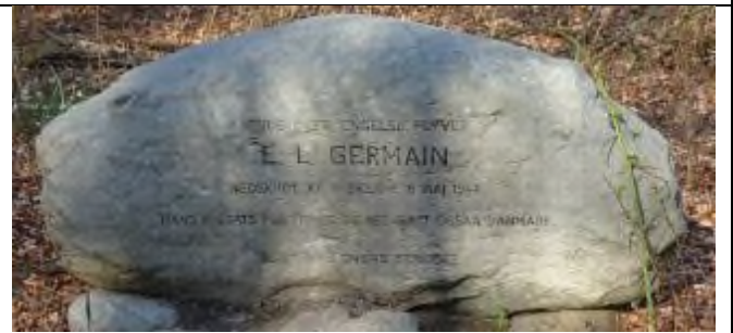
6. FLYVERSTENEN – The Aviator Stone.