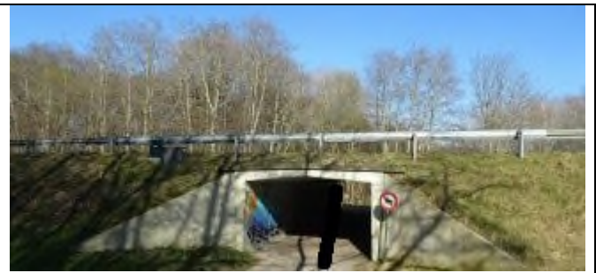
2. Under vejen, til venstre ved rødt/hvidt skilt.