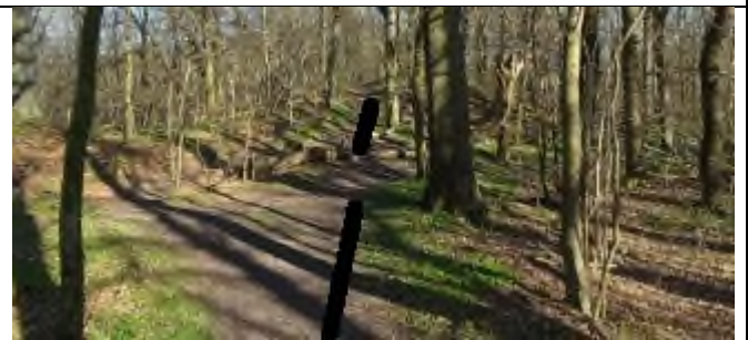
4. Lige ud.