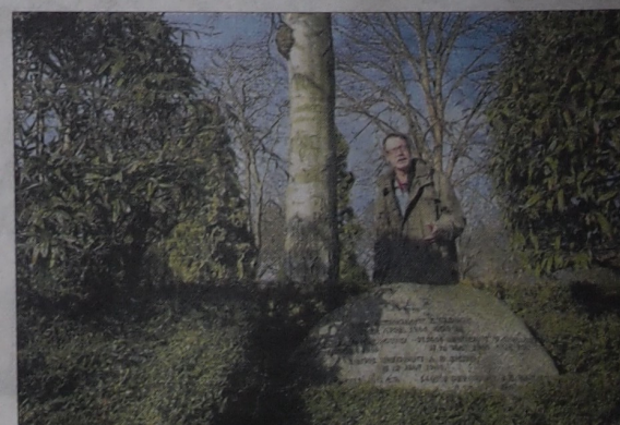
Her hviler RAF-piloter som blev nedskudt i henholdsvis 1942 og 1944. Krigshelte, som aldrig nåede hjem.