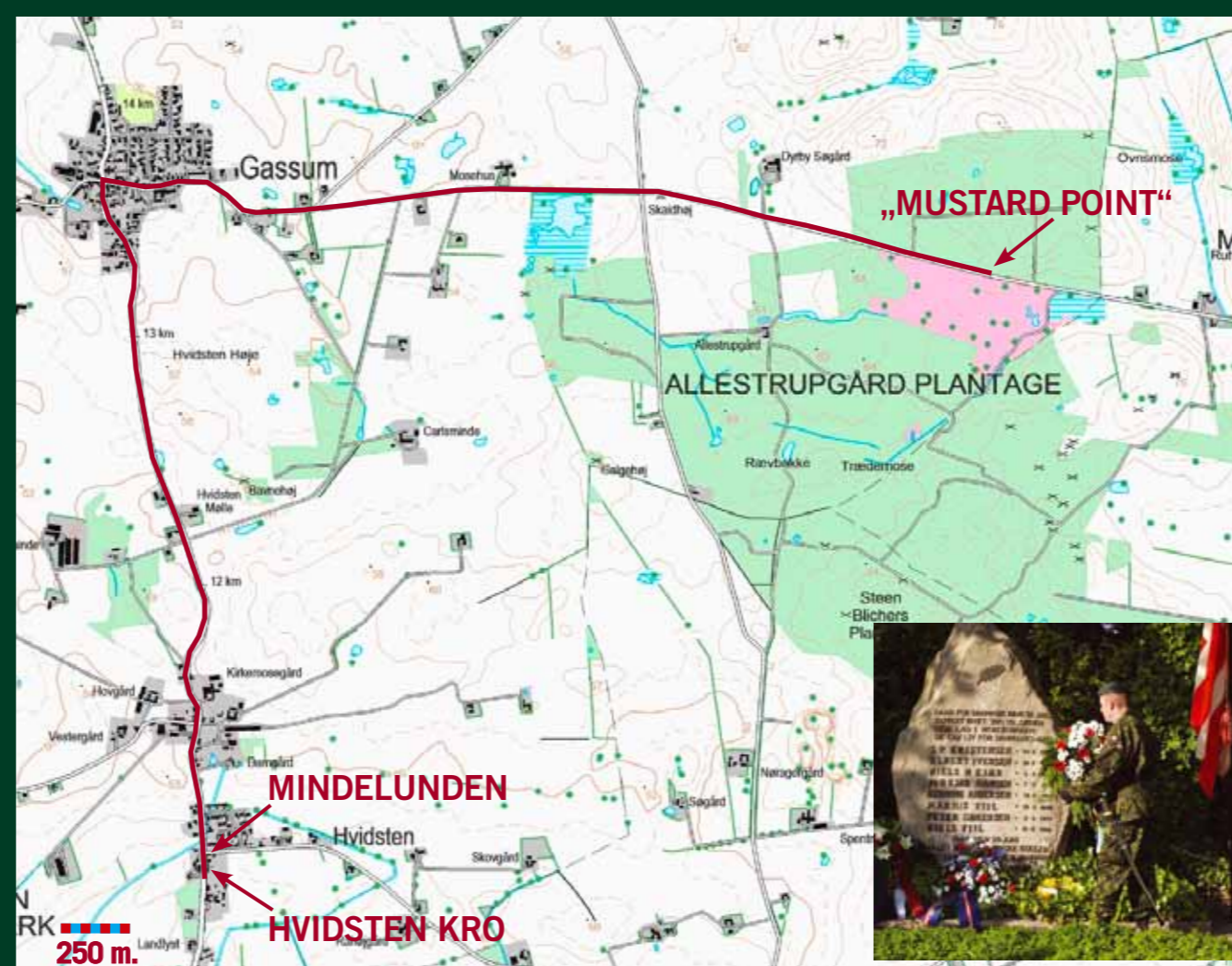
Det øde nedkastningssted "Mustard Point" lå tæt på Hvidsten med gode skjulesteder. Læs mere om Hvidstengruppen på informationstavlerne i Mindelunden og ved Hvidsten Kro.