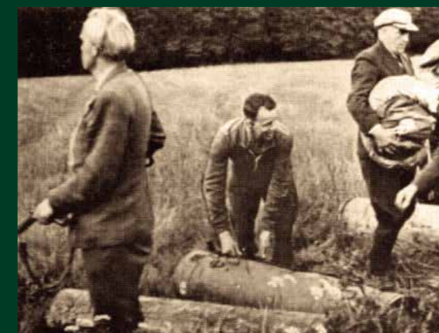
Hvidstengruppen i aktion på Mustard Point.

Mindestenen ved denne informationstavle blev rejst den 3. juli 1997 af Frihedskampens Veteraner på initiativ af Henning Dam.