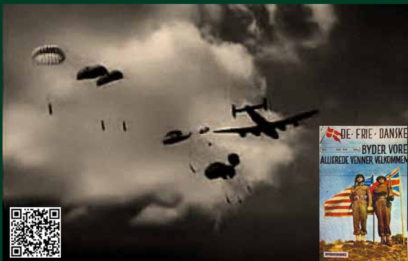
Nedkastning af våbencontainere fra engelsk Halifax fly. Indsat forsiden fra det illegale blad "De Frie Danske" juni 1944.

"Lyt igen kl. 21.15" lød signalet fra BBC i London. Så var der fly på vej i natten til Hvidstengruppen i det tyskbesatte Danmark.