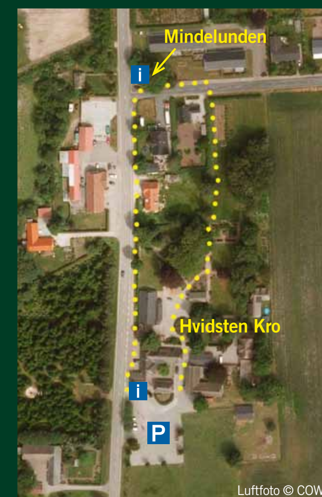
Hvidsten Kro med sti gennem haven til mindelunden for de faldne fra Hvidstengruppen.

sultat af en overset overbooking. I 2001 blev Hvidsten Kro og de omliggende bygninger gennemgribende restaureret gennem frivillige bidrag og fondsmidler.