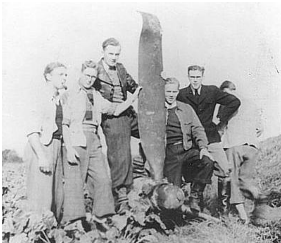
Gruppefoto ved propelblad