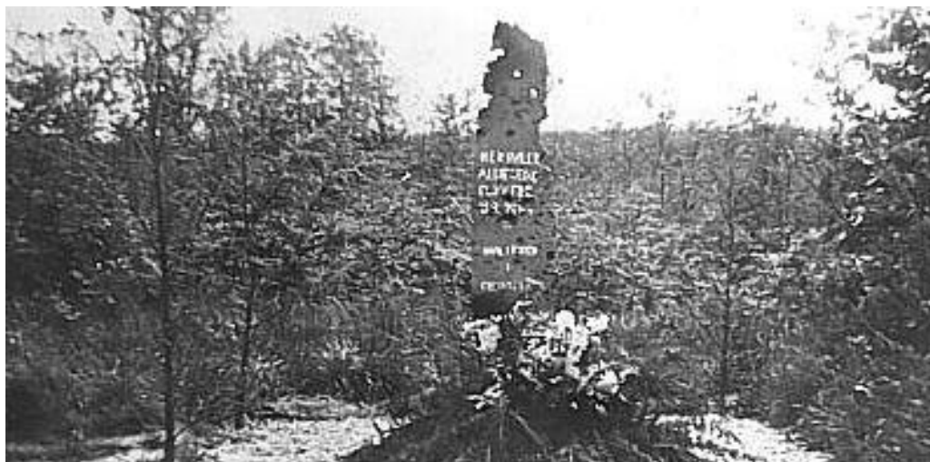
Højen i Nørreskoven hvor de dræbte indledningsvis blev begravet.

Efter krigen blev de i højen begravede ligrester ført til de allierede flyvergrave i Aabenraa og der blev rejst en mindesten med inskriptionen: RAF 16-9-1944. Propelbladet findes i dag på museet på Sønderborg Slot. Informationstavle på stedet er sat på 60-års dagen, 16. september 2004.