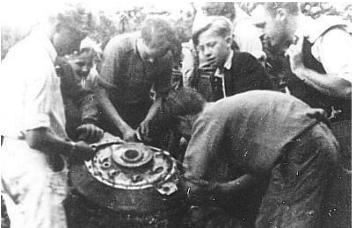
En af flymotorerne betragtes af lokale