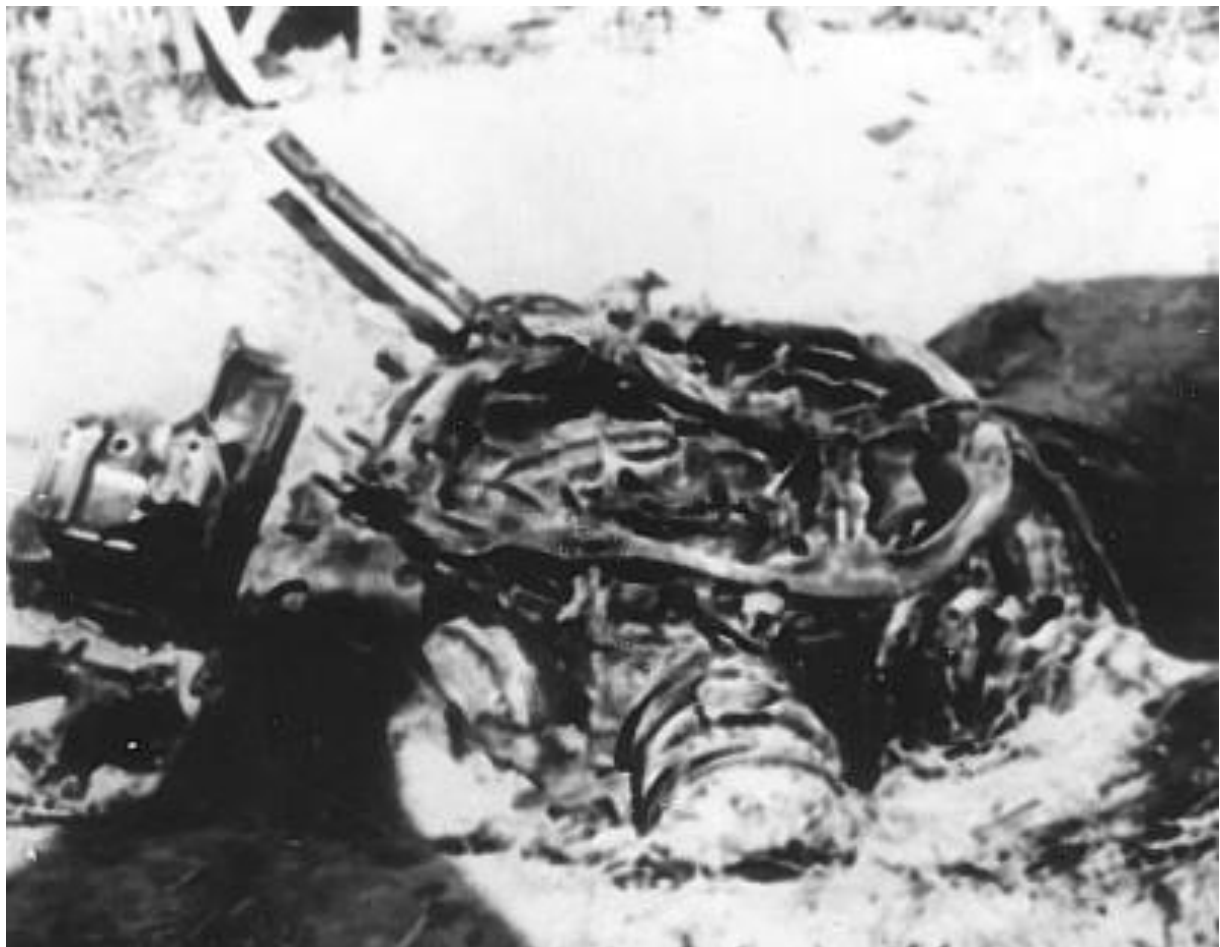
Motordele i området ved skoven