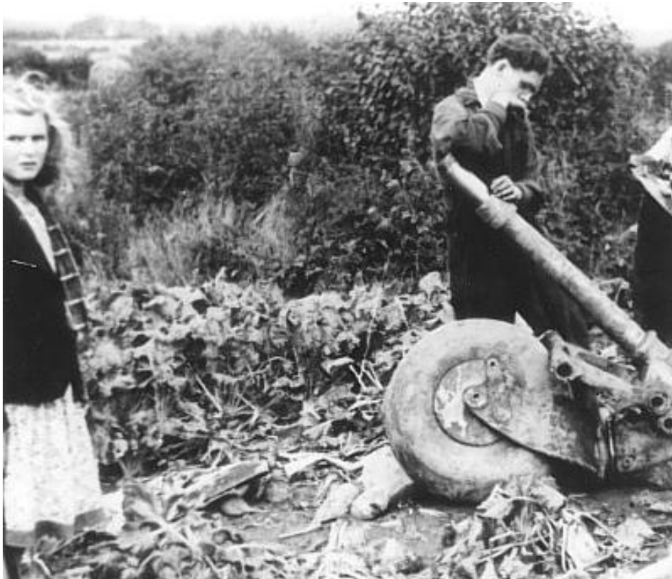
Dele fra et af landingsstellene