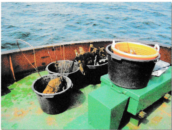
Ilttank og diverse elektriske dele