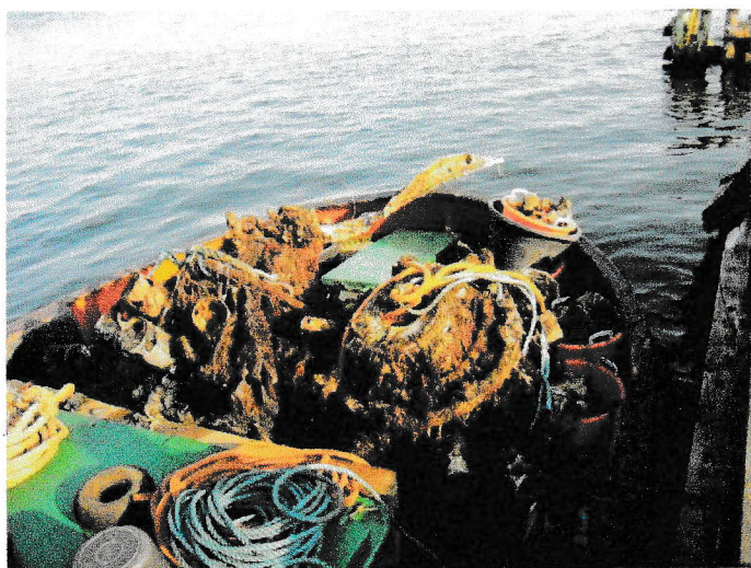
Dagens høst 2 stk. "Bristol Herkules XVI", luftkølet, ventilløs stjernemotorer på dækket af "Explorer"