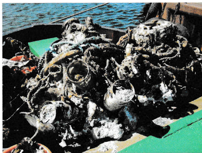
Rensningen af motorerne har taget sin begyndelse