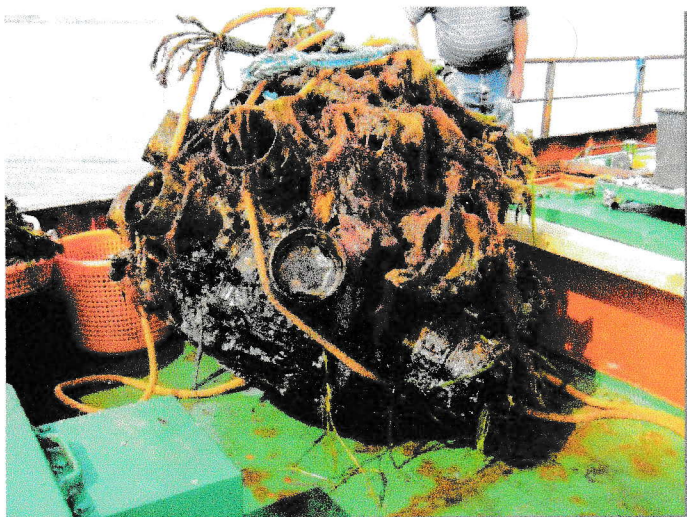
Første motor på dækket