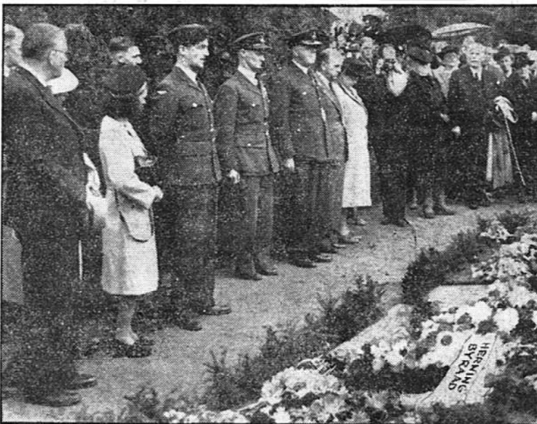
Ved graven i Skarrild, den 28. august 1946.