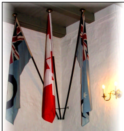
RAF-flag ophængt i Skarrild kirke.

Forskellige kilder oplyser om arbejdet og forberedelserne til RAF-monumentet, at der var etableret en forbindelse til et RAF-kontor i Esbjerg, som bl.a. fremskaffede propellen til graven. Den kom til Clasonsborg i oktober 1945. Mindesmærket blev opført, og det stod færdig til indvielse den 27. august 1946 på toårsdagen for flystyrtet i Sdr. Grene.