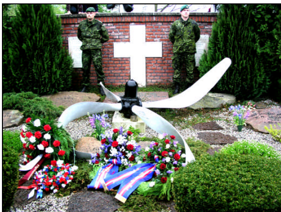
Monument og flyvergrav i Skarrild, 5. maj 2003.

Den enkle og særegne begravelse samt den meget gribende højtidelighed på kirkegården blev overvåget af tyske officerer. De var temmelig utilfredse med befolkningens reaktioner og udviste sympati, hvilket bagefter blev påtalt i kraftige vendinger over for landbetjenten.