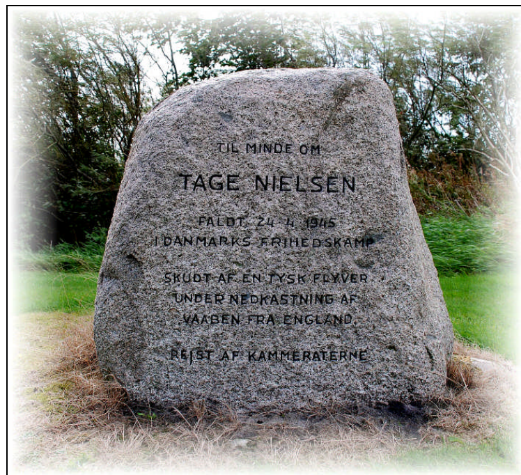
Mindesten ved Ørum flyveplads (Skive Lufthavn) – ved indkørsel til svæveflyvercentret. Tage Nielsen, dræbt af tyskerne under operation ved modtagelse af våben.