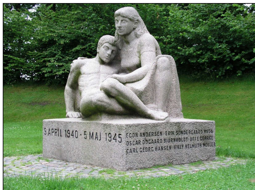
Mindeparken i Herning. Monument for besættelsestidens ofre. Afsløret i 1951. Udført af Eigil Vedel Schmidt.