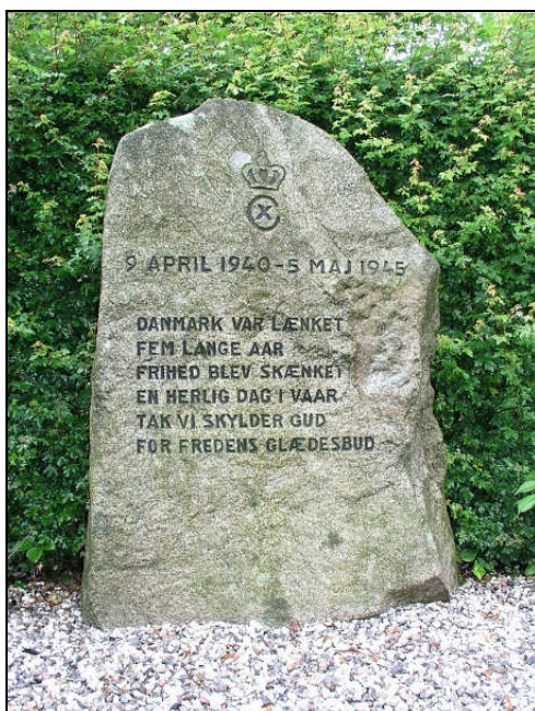
Befrielsesmindesten i Gullestrup v. Herning.