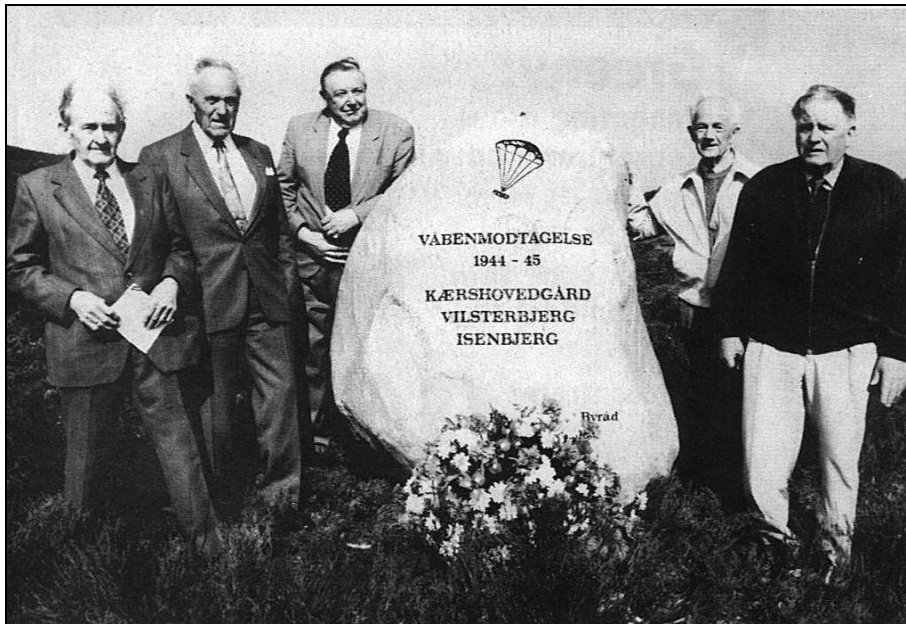
Mindesten ved Isenbjerg – rejst som minde over våbenmodtagelser, 4. maj 1995.