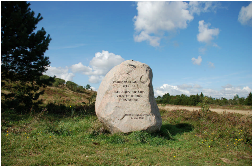
Mindestenen ved foden af "Isenbjerg". Rejst 4. maj 1995. Foto, august 2008.