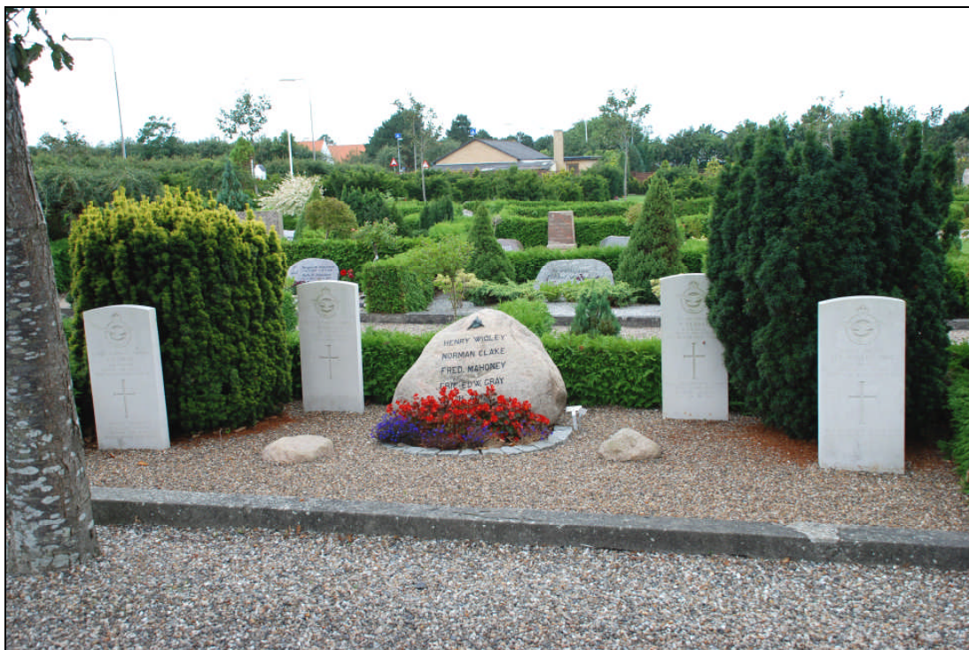
Løgstør kirkegård – Grave for fire britiske flyvere med headstones. Danske mindesten med flyvernes navne.